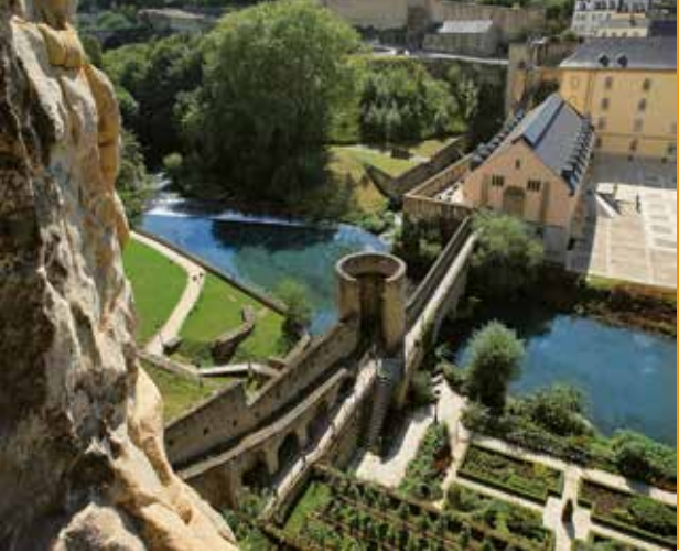
Las Casamatas del Bock: vista de las aspilleras