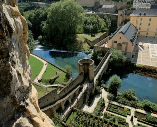
Las Casamatas del Bock: vista de las aspilleras