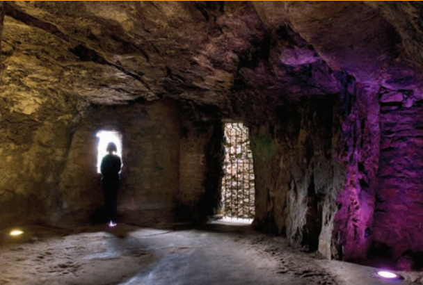
Bockkazematten: waterput van Mélusine