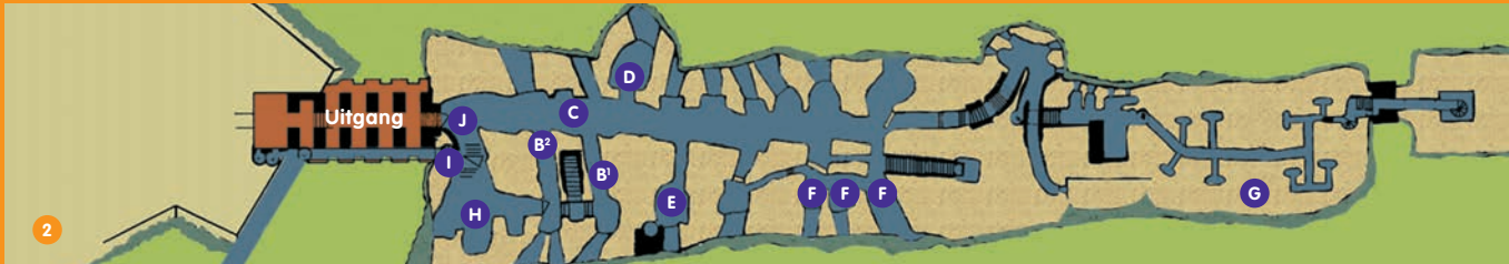
1 Bockkazematten: zij aanzicht