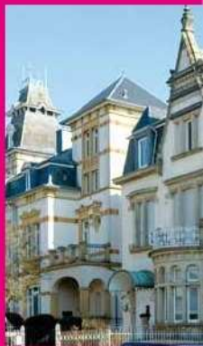
[15] Rue des Roses