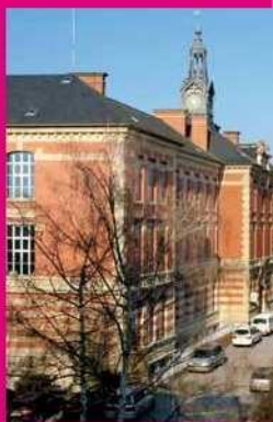
[18] Place Auguste Laurent