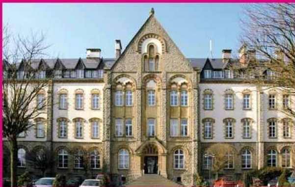
[7] "Rosencampus" der Universität von Luxemburg