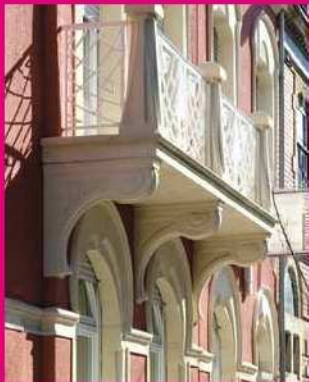
[21] Avenue Pasteur