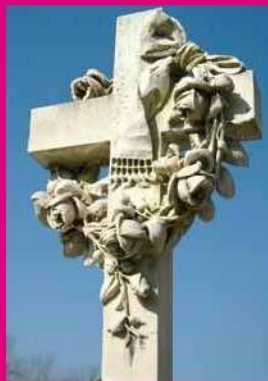
[1] Friedhof Notre-Dame