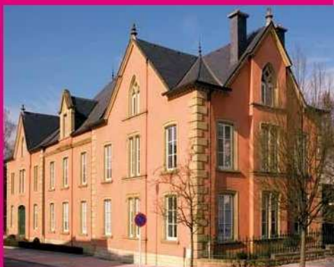
[5] “Maison Soupert”