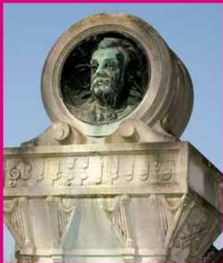
[1] Friedhof Notre-Dame (A. Zinnen)