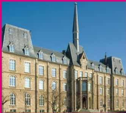
[14] "Lycée Technique des Arts et Métiers"

Abstecher: Tüchtige Wanderer können am [13] jüdischen Friedhof nach links abbiegen, um die Rue des Glacis zu erreichen. In der Talsohle führen in der Nähe der Verkehrsampeln Treppen an der Grotte des "Péiter Onrouv" vorbei, zum Felsen des Crispinus. Oben