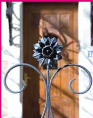
[17] Avenue du Bois (geformte Rose)